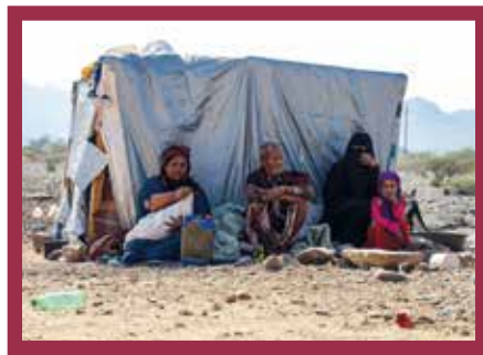
Une famille yéménite devant sa « maison »