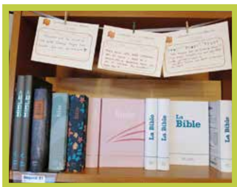
Les cartes accrochées dans la librairie