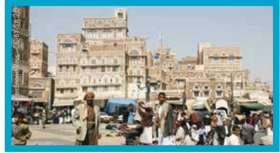
Saana, la capitale