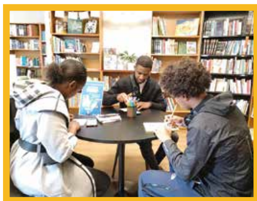
Les clients remplissent les cartes à l'occasion des 20 ans de la librairie.