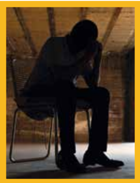
Les ravages de la guerre civile