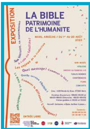
Le questionnaire de découverte de la Bible

Différents supports d'écriture (argile pour l'écriture cunéiforme, papyrus, parchemin,