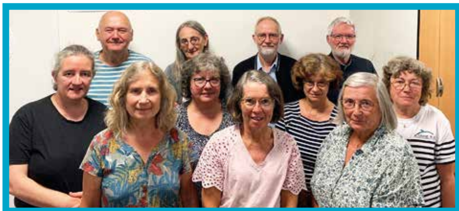
L'équipe actuelle des bénévoles engagés dans ce témoignage au cœur de la ville de Nantes