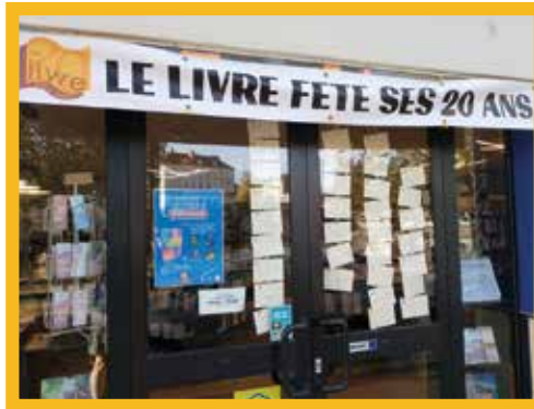
La librairie rénovée

L'automne dernier, au mois d'octobre, nous avons donc fêté nos 20 ans d'existence. Cela a été l'occasion de réaliser des changements visant à agrandir le plus possible l'espace de vente et à embellir la boutique. Et nous sommes très satisfaits du résultat! Nous sommes en outre très reconnaissants aux frères et sœurs qui ont donné de leur temps pour nous aider à concrétiser ce projet de rénovation.